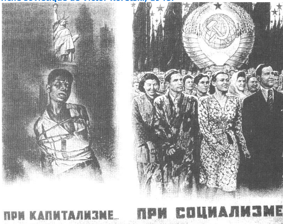
Document 3 : Affiche soviétique de Victor Koretski, 1948.

Traduction : "Sous le capitalisme ... Sous le socialisme".